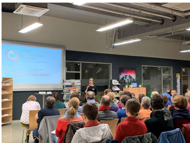
Forum Flüchtlingshilfe im November 2019